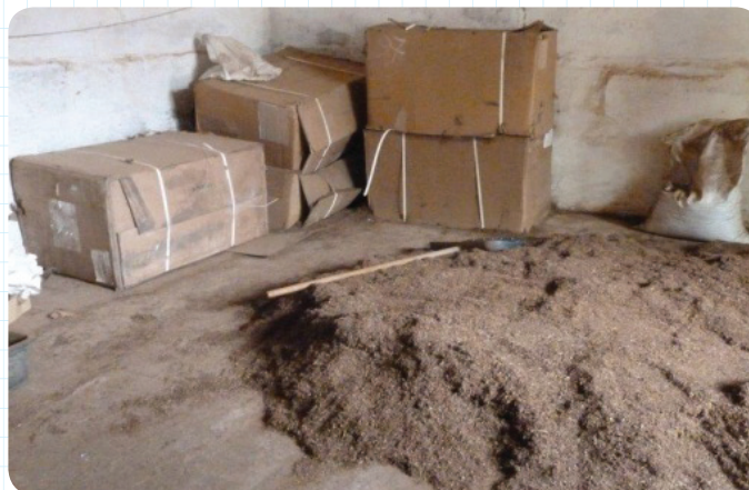
Фото: Смешивание табака на одной из нелегальных табачных мануфактур.

Поддельные сигареты представляют большой риск возникновения пожара, так как в них нет компонентов, которые заставляют сигарету тухнуть, если ею не затягиваются. Зачастую, они производятся в антисанитарных условиях. Лабораторный анализ контрафактных сигарет как-то показал присутствие таких «ингредиентов», как кусочки компакт дисков и крысиные экскременты.