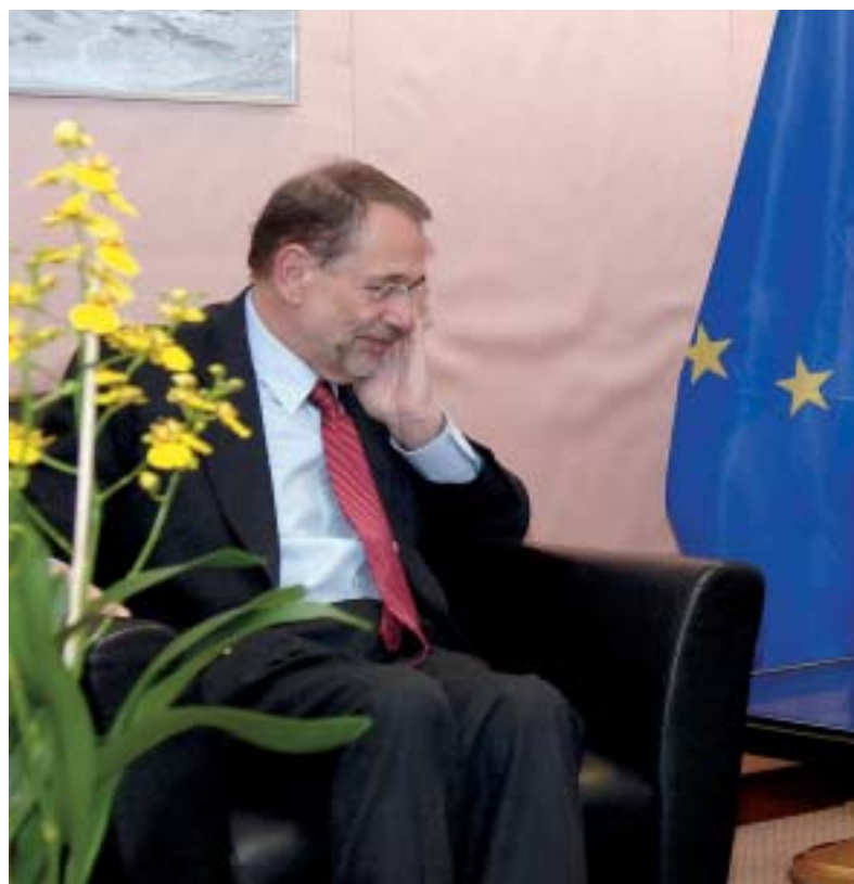
Хавьер Солана, Верховный представитель ЕС по внешней политике и политике безопасности, и Ференц Банфи, Глава Миссии ЕС

Миссию посетили многие послы ЕС в Кишиневе и Киеве, а также бывший и действующий послы США в Кишиневе. Миссия принимала различные делегации из стран ЕС и из России.