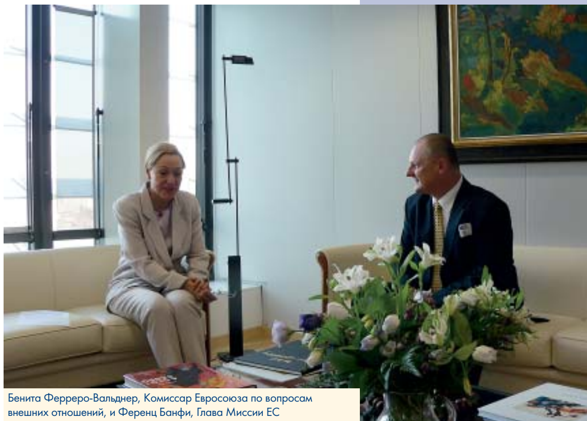
Бенита Ферреро-Вальднер, Комиссар Евросоюза по вопросам внешних отношений, и Ференц Банфи, Глава Миссии ЕС